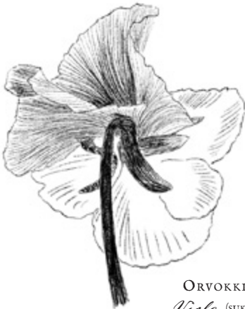
ORVOKKI Viola (suku)

3 Mikä luonnossa tuo sinulle eniten iloa? Entä rauhaa?